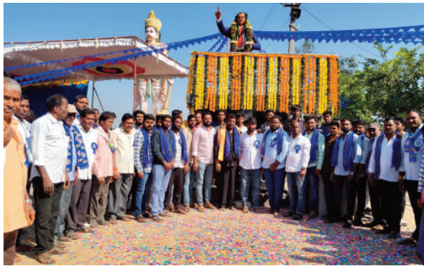
రోజు ధర్మపురికి ఎమ్మెల్యేగా గెలిచే నాయకులు, మండల పార్టీ అవకాశం వచ్చిందన్నారు. కార్య నాయకులు, కార్యకర్తలు, ప్రజలు క్రమంలో దళిత సంఘల తదితరులు పాల్గొన్నారు.